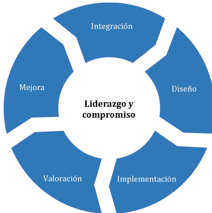
Figura 3 — Marco de referencia

La organización debería valorar sus prácticas y procesos existentes de la gestión del riesgo, valorar cualquier brecha y abordar estas brechas en el marco de referencia.